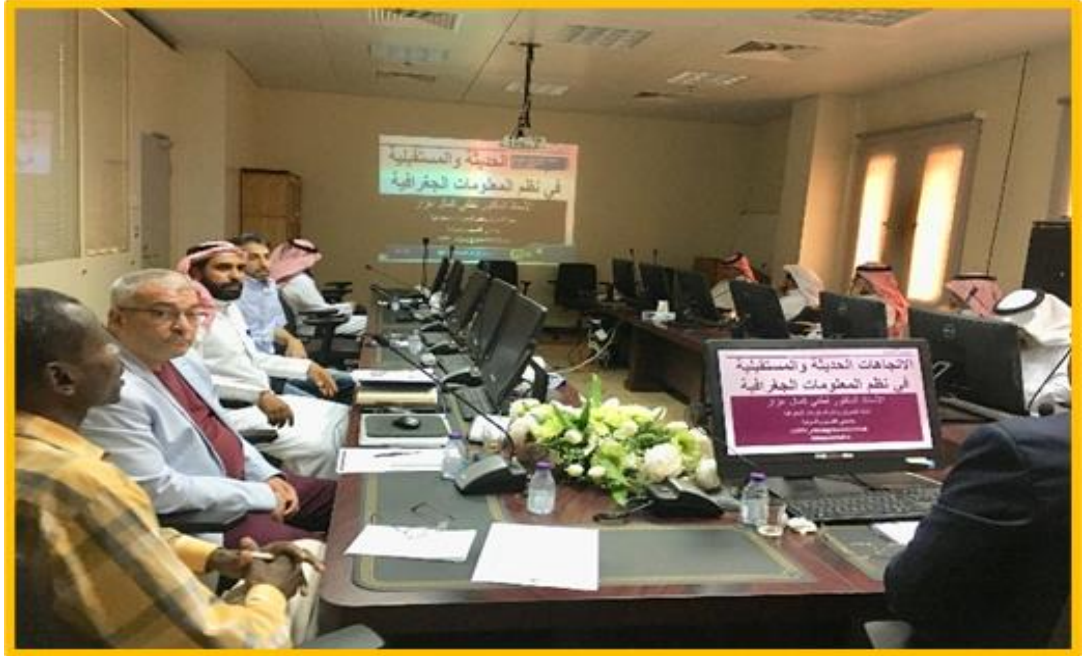
جانب من قاعات الكلية المعدة للتدريب